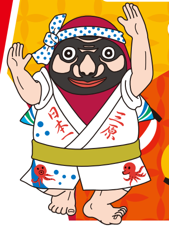
三原市公式マスコットキャラクター やっさだるマン